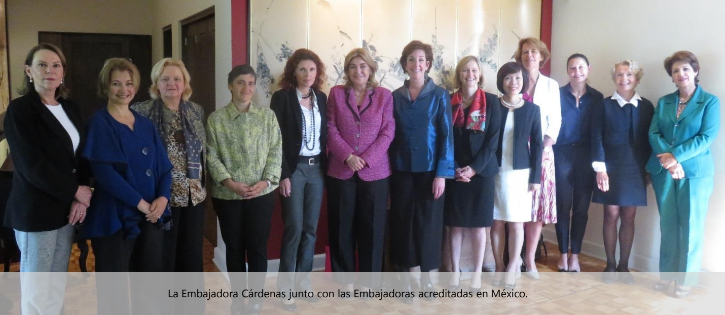
La Embajadora Cárdenas junto con las Embajadoras acreditadas en México.