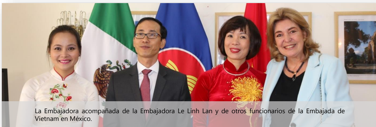
La Embajadora acompañada de la Embajadora Le Linh Lan y de otros funcionarios de la Embajada de Vietnam en México.

Las Embajadoras se comprometieron a trabajar en diferentes frentes para dar apoyo en conjunto a las diferentes iniciativas en pro de la mujer que lidera en Gobierno de México.